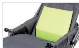
Cojín lumbar (Nº ref.: ACPODUL)