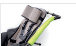
Protectores de manos (Nº ref.: ACOCHRAC)