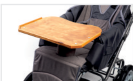
Mesita (Nº ref.: ACSTOL)