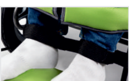
Cinturones para pantorrillas (Nº ref.: ACPASŁ)