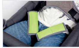
Cinturones para muslos (Nº ref.: ACPASU)