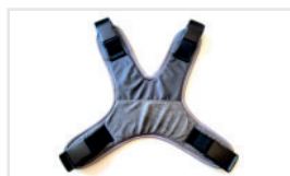
Cinturones de seguridad (Nº ref.: ACPASBEZPR)