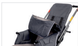
Doble tapizado (Nº ref.: ACTAPW)