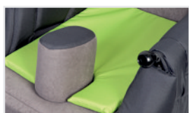
Cuña interfemorales (abducción) (Nº ref.: ACKLIN)