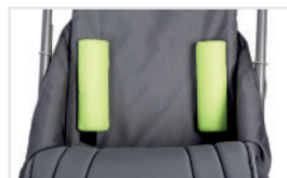
Soportes lumbares (Nº ref.: ACPODPL)