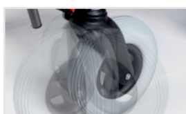
Ruedas resistentes giratorias (Nº ref.: SK1)