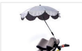
Sombrilla (Nº ref.: PARASOL.KOL.)