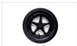
Ruedas Fijas (Nº ref.: ST)