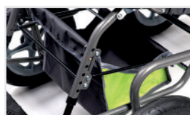
Bolsa (Nº ref.: ACTORPWW)