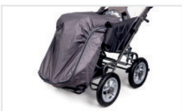
Saco de dormir (Nº ref.: ACŚPI)