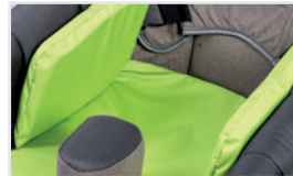
Cojines laterales (Nº ref.: ACPODUB)