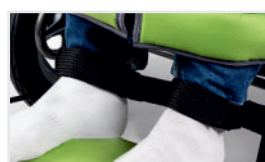
Cinturones para tobillos (Nº ref.: ACPASK)