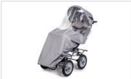
Capota con colcha (Nº ref.: BUDA)