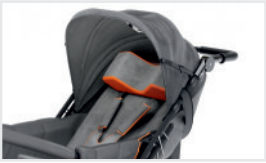
Capota (Cat. no.: ACDASZ)