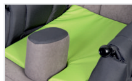
Cojín del asiento (Nº ref.: ACPODUS)