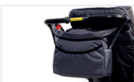
Bolsa para el manillar (Nº ref.: TORBA.KOL.)