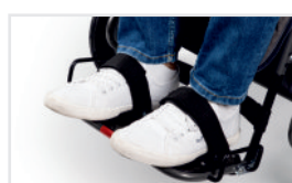
Cinturones para pies (Nº ref.: ACPASS)