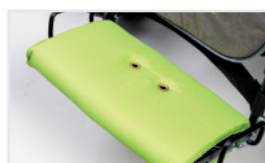
Protector de reposapiés (Nº ref.: ACOCHPOD)