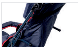
Deformált háthoz igazított háttámla, egyedi készítés a hát alakjához (Kat.szám: ACTAPG)