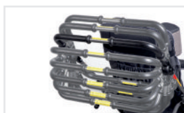
Állítható tolókar fogantyú A gondozó magasságához állítva (Kat.szám: RŁ)