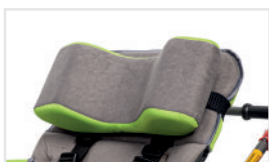
Fejtámla (Kat.szám: ACZAG)