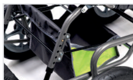
Alsó tárolókosár (Kat.szám: ACTORPWW)