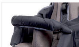
Első kapaszkodó (Kat.szám: ACBAR)