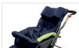
Megemelt könyöklők (Kat.szám: PP)