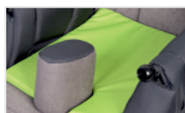
Sittdyna (Katalognummer: ACPODUS)