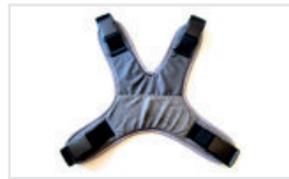
Säkerhetsbälten (Katalognummer: ACPASBEZPR)