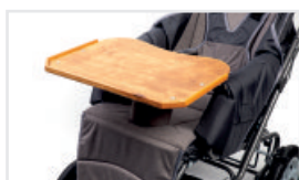
Bord (Katalognummer: ACSTOL)