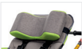
Nackstöd (Katalognummer: ACZAG)