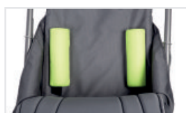
Stöd för ländryggen (Katalognummer: ACPODPL)