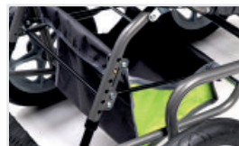
Undre vagnväska (Katalognummer: ACTORPWW)