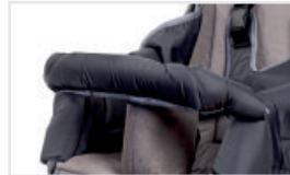
Frambåge (Katalognummer: ACBAR)