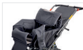
Ytterklädsel (Katalognummer: ACTAPW)