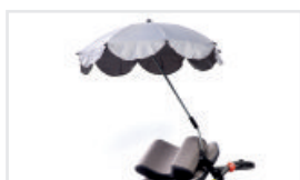
Parasoll (Katalognummer: PARASOL.KOL.)