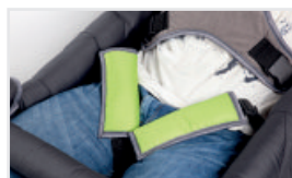
Lårremmar (Katalognummer: ACPASU)