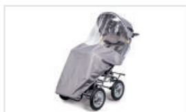
Sufflett med förkläde (Katalognummer: BUDA)