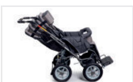
Ryggstödet kan ställas i halvliggande- eller liggande position. (Katalognummer: OL)