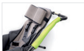
Handtagsskydd (Katalognummer: ACOCHRAC)