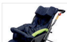
Upphöjda armstöd (Katalognummer: PP)