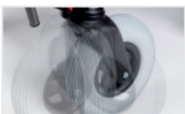
Svängbara hela hjul (Katalognummer: SK1)