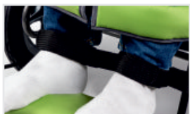
Vadband (Katalognummer: ACPASŁ)