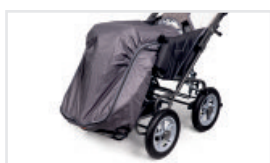
Sovsäck (Katalognummer: ACSPI)