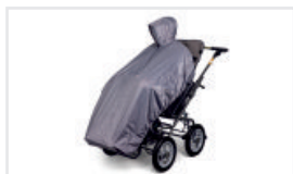
Regnskydd (Katalognummer: ACPEL)