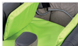
Sidokuddar (Katalognummer: ACPODUB)