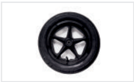
Fasta hjul (Katalognummer: ST)