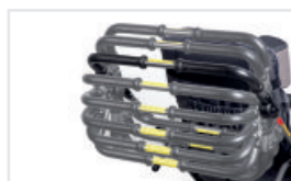
Justerbart handtag (Katalognummer: RŁ)