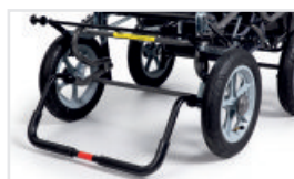
Anti-lutningskydd (Katalognummer: ACUPP)