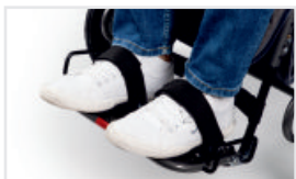
Fotband (Katalognummer: ACPASS)