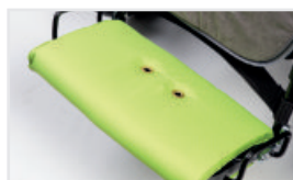
Fotstödsskydd (Katalognummer: ACOCHPOD)