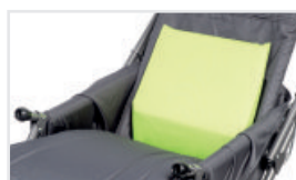
Ländkudde (Katalognummer: ACPODUL)