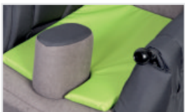
Kilstöd för låren (abduktiv) (Katalognummer: ACKLIN)