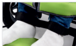
Ankle belts (Katalognummer: ACPASK)