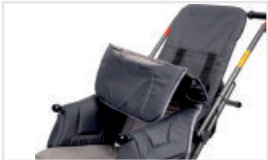
Dubbelklädsel (Katalognummer: ACTAPW)