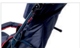
Ryggstöd anpassat till puckeln (Katalognummer: ACTAPG)